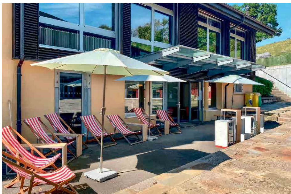
L'espace de vie offre un cadre chaleureux et moderne aux élèves

L'établissement se dote d'un nouvel espace pour accueillir les élèves durant la pause de midi. Une ouverture qui s'inscrit dans la politique globale du service Jeunesse.