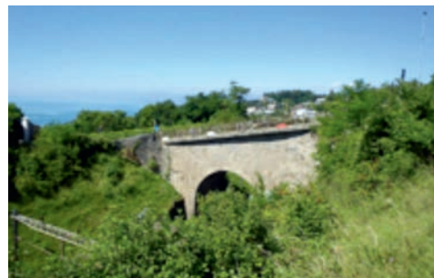
Vue Est du passage supérieur.

En été 2016, lors du renouvellement de l'enrobé du trottoir de la route de La Croix, d'importants dégâts ont été mis à jour sur le trottoir situé côté Ouest du pont, laissant apparaître sur 3-4 mètres de longueur des armatures corrodées.