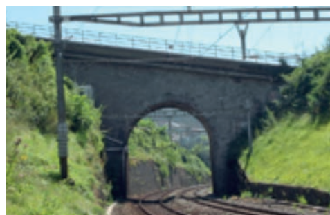
Vue Ouest du passage supérieur.

https://www.lutry.ch/lutry-officiel/conseil-communal/seances/calendrier-et-documents/seance-du-lundi-26-juin-2017/