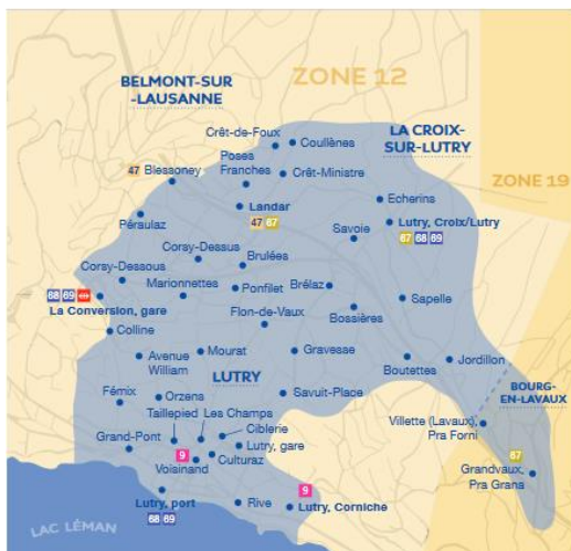
Figure 3 : périmètre du Taxibus sur la Commune de Lutry

Afin de compléter l'offre en transports publics sur l'axe NORD-SUD, un service de Taxibus est également disponible. Il s'agit d'un service sur demande dans les secteurs non servis en permanence par les transports publics. Pour la Commune de Lutry, le Taxibus est disponible sur le périmètre en bleu visible sur la figure 3.