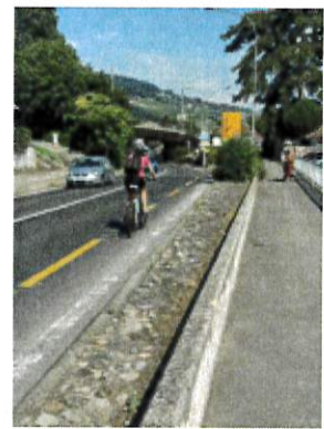
Figure 2: pictogrammes vélos et piétons sur le quai Gustave Doret et rafraîchissement de la bande cyclable à la route d'Ouchy

Par ce projet, la Municipalité est convaincue de poser les bases solides pour une mobilité sécurisée et de préserver la qualité de vie de ces citoyens.