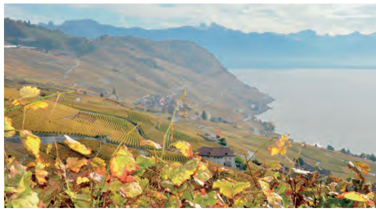
Poste du Théâtre de l'Echallas.