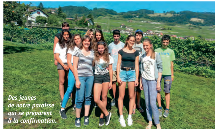
Des jeunes de notre paroisse qui se préparent à la confirmation.