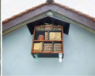
Parc de Burquenet.