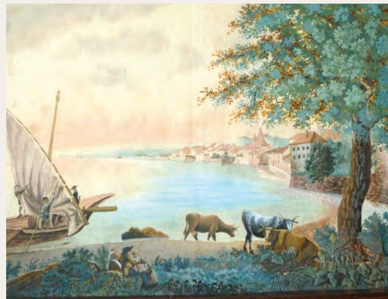
Vue de l'est de Lutry, avant 1792, peintre inconnu, tableau acquis récemment par la Commune.

L'enrochement et le remblayage progressent barquée par barquée; ce n'est qu'en novembre 1905 qu'est déposé un projet complet de quai dessiné par l'architecte Louis Buche pour permettre de commencer ou de continuer la construction d'un mur de quai, dont il est encore question en 1916. De nombreuses années seront nécessaires pour