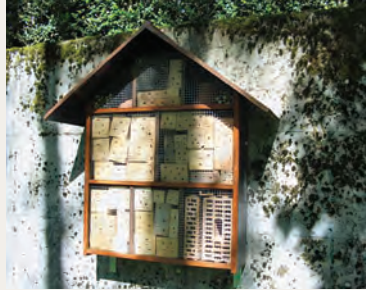
Cimetière de Flon de Vaux.