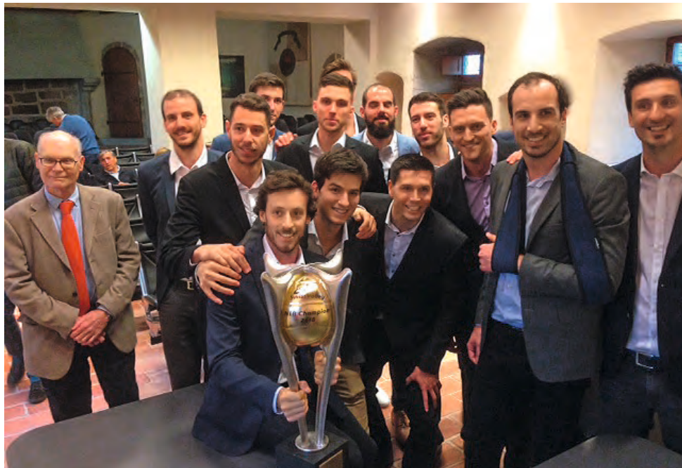
Les joueurs de Lutry-Lavaux en compagnie de Jacques-André Conne, Syndic de Lutry.